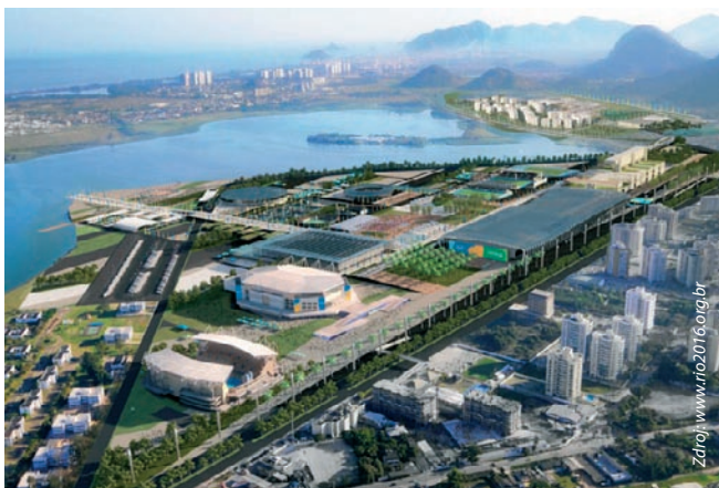
Vizualizace olympijské vesnice

V sobotu 2. října uplynul přesně jeden rok od chvíle, kdy MOV rozhodl, že letní olympijské hry 2016 bude hostit Rio de Janeiro. Do vzplanutí olympijského ohně v Brazílii sice ještě schází více než dva tisíce dní, ale za uplynulý rok už jihoameričtí pořadatelé udělali pořádný kus práce.