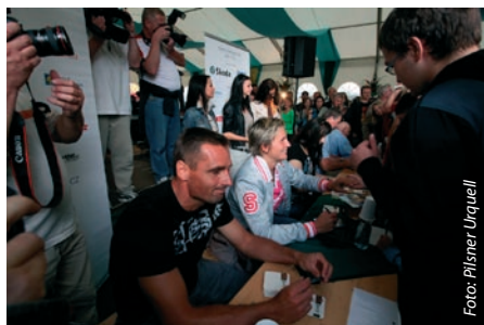
Sport Foto v Plzni