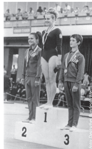
Ilustrační foto, Věra Čáslavská uprostřed.

Čáslavská získala na OH v Mexiku čtyři zlata a dvě stříbra v gymnastických disciplínách. Během slavnostního ceremoniálu při předání medailí protestovala proti okupaci Československa, když stála se sovětskou závodnicí Larissou Petrikovou na stupních vítězů. Při sovětské hymně otočila hlavu od soupeřky směrem do země.