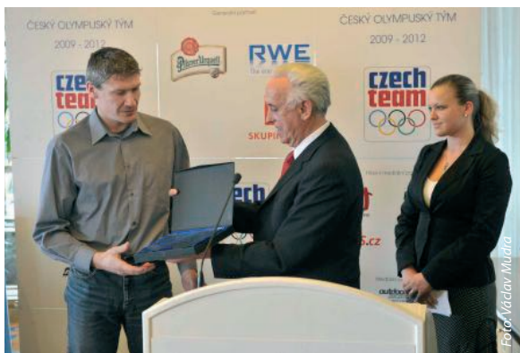
Prezident Evropského hnutí fair play Carlos Gonçalves bude letos kongres zahajovat. V roce 2009 předal ocenění EFPM Miroslavu Podborskému, českému reprezentantovi v kvadriatlonu.

„Mezi pozvanými je několik klíčových českých institucí, které vychovávají budoucí učitele – zástupci FTVS nebo pedagogických fakult. Právě tito lidé budou klíčoví pro to, aby se nám podařilo dostat program fair play do praxe. Pokud kantor nedokáže použít poznatky v praxi, jsou všechny teorie a metodické příručky zcela k ničemu. Takže pokud to shrnu, na kongresu popíšeme současnou situaci a budeme diskutovat, jak se dá řešit.“