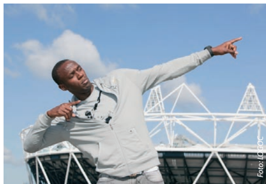
Nejrychlejší muž světa Usain Bolt před Olympijským stadionem v Londýně.

Chrpy, měsíčky, vlčí máky a další luční kvítí rozkvetly v blízkosti londýnského Olympijského stadionu. Barevná louka dělicí stadion od břehu řeky je první z plánovaných květinových porostů, které ve finále pokryjí plochu deseti fotbalových hřišť. Květiny jsou namíchány a vysety tak, aby se v plném květu ukázaly při zahájení Her. Zkontroloval to i sprinter Usain Bolt.