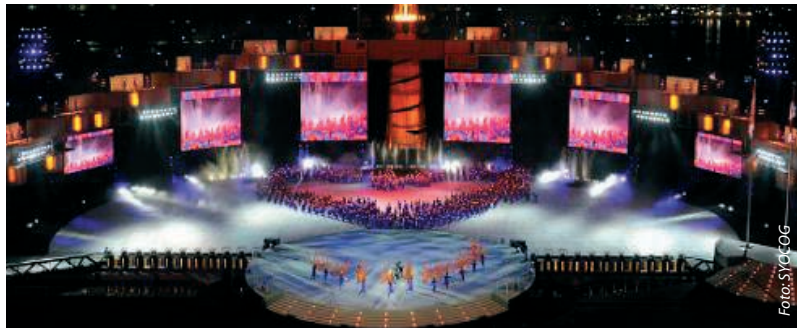
Slavnostní zakončení Olympijských her mládeže