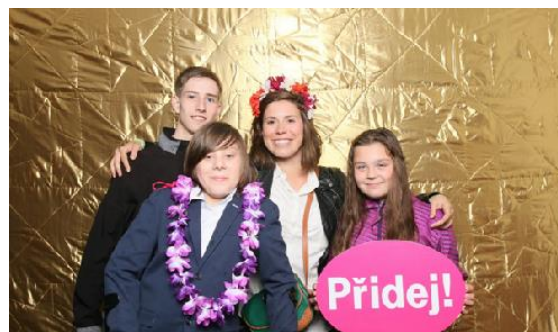
Všichni jsme jeden tým #czechteam

Při 13. zasedání komise České olympijské nadace včetně snowboardistky Evy Samkové rozhodla o podpoře dalších 84 holek a kluků ve třiceti sportech, kteří by jinak nemohli sportovat kvůli nedostatku peněz. „Je to super pocit, jsme teď nabitá dobrem,“ řekla Samková. Mladým sportovcům bylo rozděleno 464 450 korun, od svého vzniku v prosinci 2012 nadace už přerozdělila souhrnnou částku 5 095 500 korun. Dohromady Česká olympijská nadace podpořila již celkem 989 mladých sportovců.